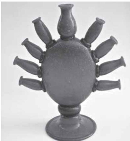
Vaso a nove bocche in vetro pulegoso verdescuro, 1928.

(Tel. 041.42730892 - www.museiciviviceneziani.it)