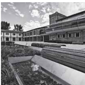
Primo Premio Edificio per attività commerciali in ex fattoria - Martellago (VE) Studio arch. Gianni Rigo