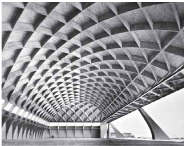
P.Luigi NERVI (1891-1979) Padiglione espositivo nel Complesso del Valentino, Torino, 1949.

Roma PIER LUIGI NERVI Architettura come sfida Ingegno e costruzione Dal 15-12-2010 al 20-03-2011 MAXXI (Tel. 06.39967350 - www.fondazionemaxxi.it)