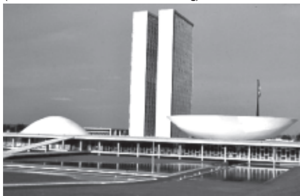
Palácio do Congresso Nacional Estado do Brasil. Prédio do Senado Federal e Câmara dos Deputados. (progetto: Lúcio Costa -Oscar Niemeyer, 1957/58)