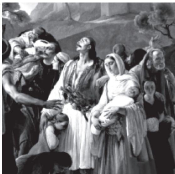
Francesco Hayez [1791-1882]

(Tel.06.39967500 - www.scuderiequirinale.it )